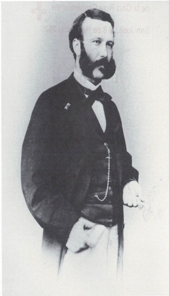
Henry Dunant en la época de la fundación de la Cruz Roja.