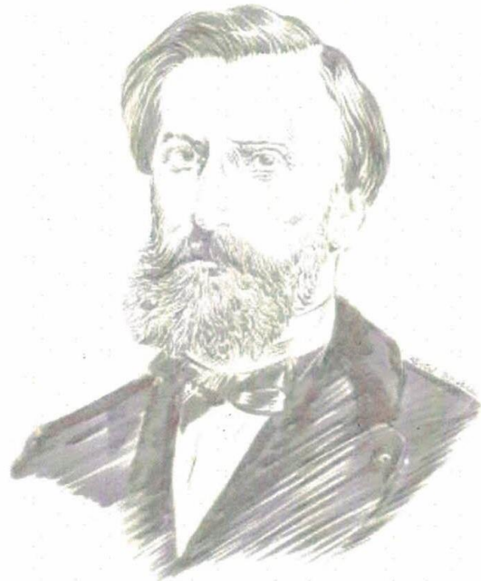
Gustave Moynier 1826 - 1910

Genève, 21 septembre 2010 deuxième édition remaniée © Association Henry Dunant + Gustave Moynier : 1910-2010 chemin Haccius 10, 1212 Grand-Lancy, Suisse www.dunant-moynier.org les presses du Phare isbn 2-940336-16-4