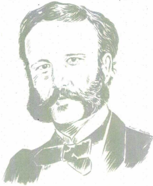
Henry Dunant 1828 - 1910

Genève, 21 septembre 2010 deuxième édition remaniée © Association Henry Dunant + Gustave Moynier : 1910-2010 chemin Haccius 10, 1212 Grand-Lancy, Suisse www.dunant-moynier.org les presses du Phare isbn 2-940336-16-4